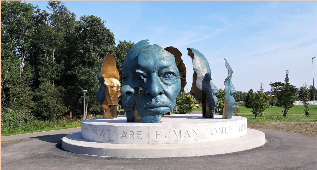
HET NELSON MANDELA GEDENKTEKEN IN HET NAAR HEM GENOEMDE PARK IN AMSTERDAM ZUIDOOST