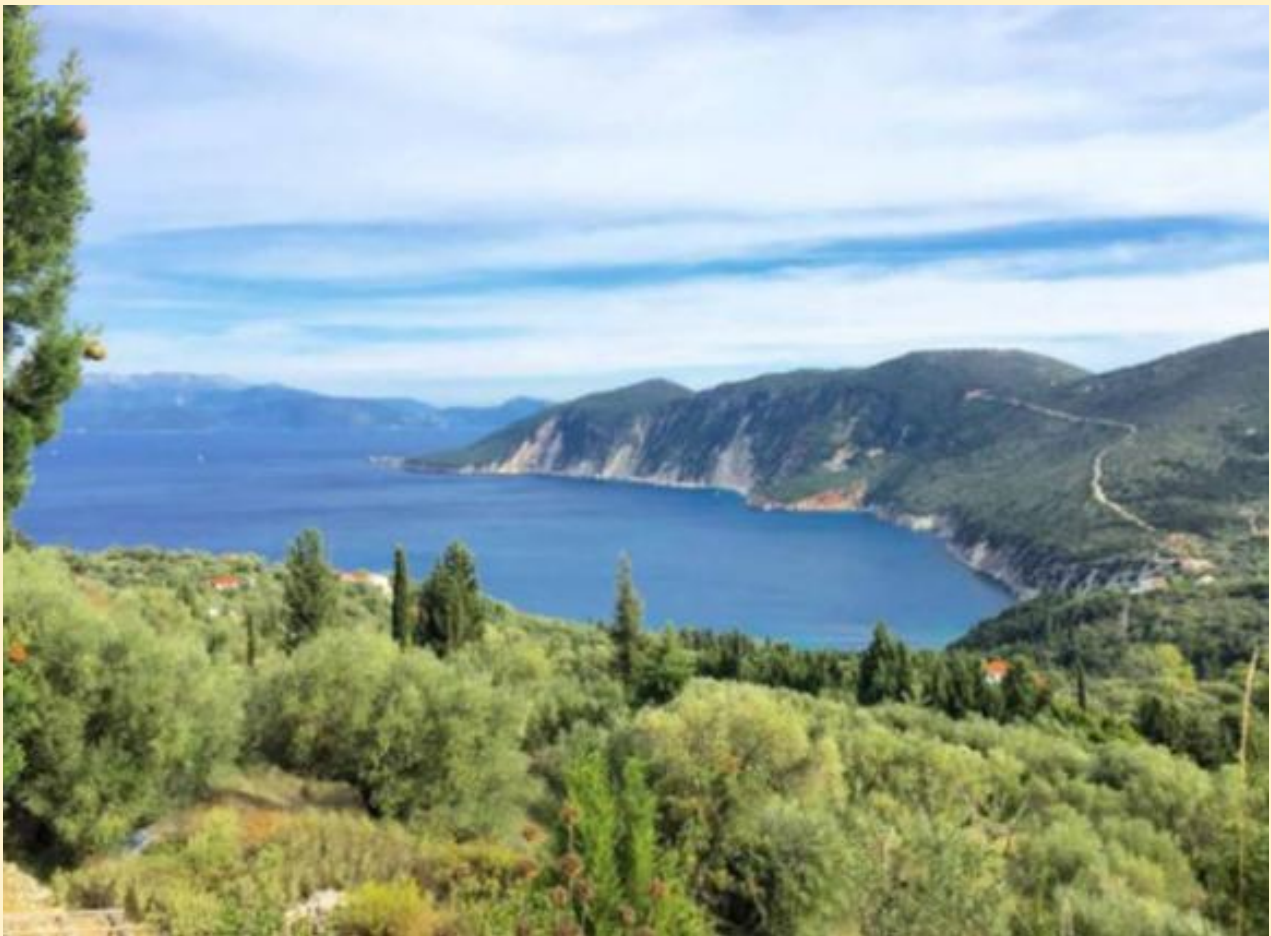
Het paradijselijke Ithaka