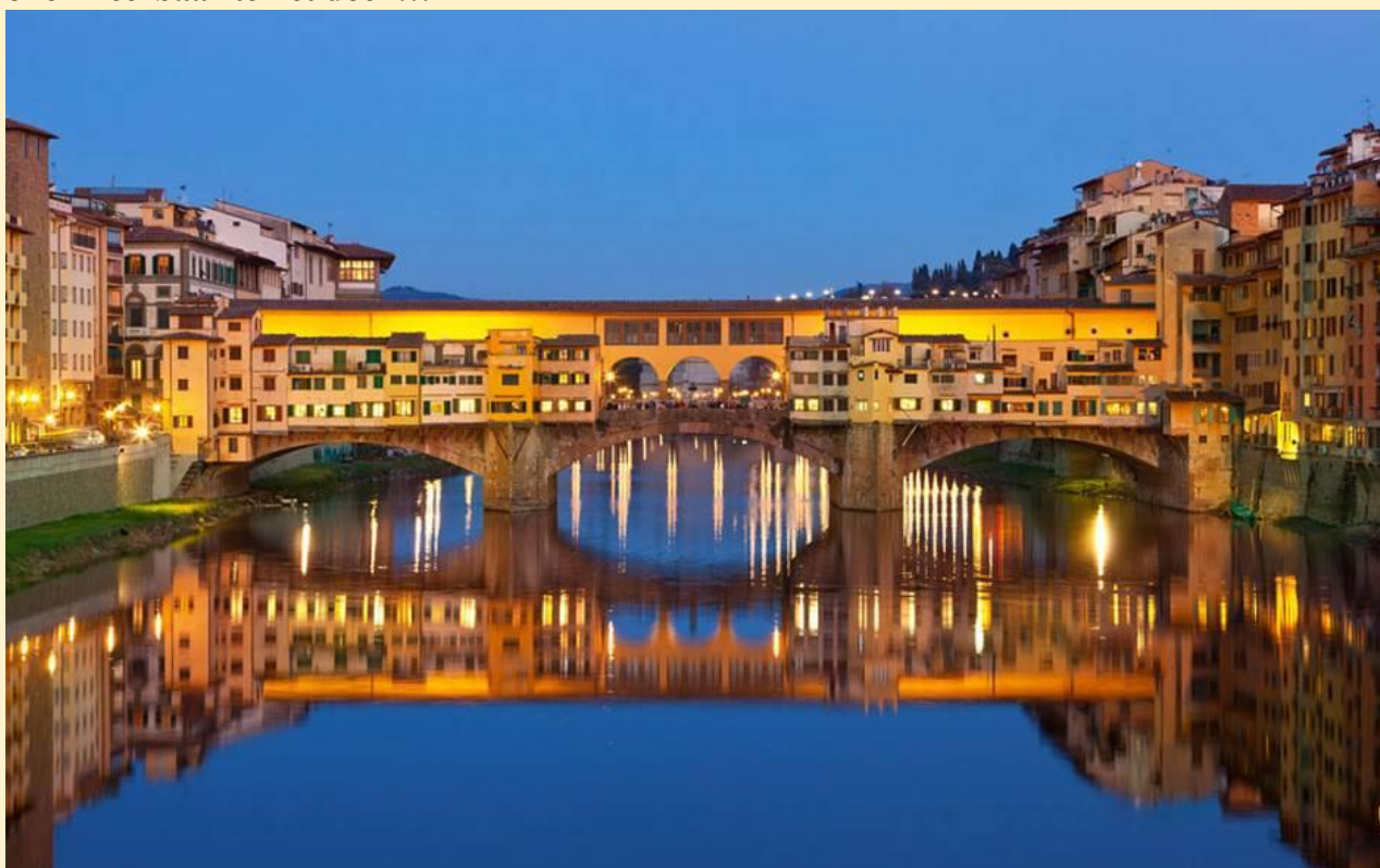
De brug die ons voor goed met elkaar verbond